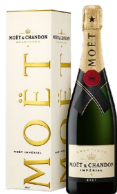
Moët & Chandon Impérial Giftbox