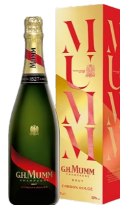
Mumm „Cordon Rouge“ Giftbox