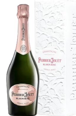
Perrier-Jouët Grand Brut Gift box