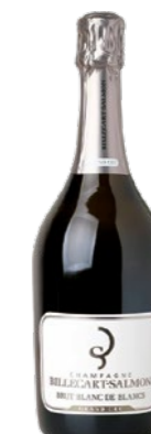
Billecart Salmon Blanc de Blancs