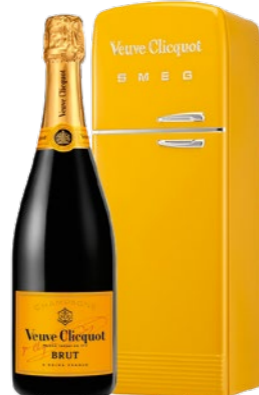
Veuve Clicquot Brut Le Fridge