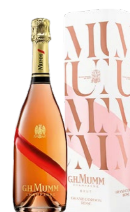
Mumm „Cordon Rouge“ Rosé, Giftbox