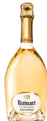
Ruinart Blanc de Blancs