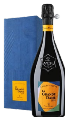
Veuve Clicquot La Grande Dame Giftbox