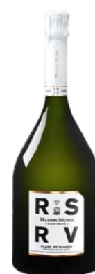
Mumm Réserve „Blanc de Blancs“