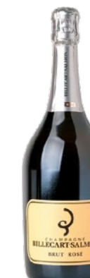
Billecart Salmon Brut Rosé