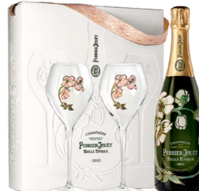
Perrier-Jouët Belle Epoque 2 skleničky