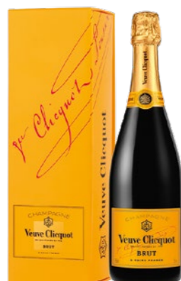
Veuve Clicquot Yellow Label Giftbox, brut