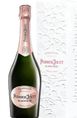
Perrier-Jouët Blason Rosé Gift box