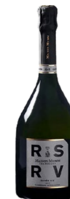
Mumm Réserve „Cuvée 4.5“