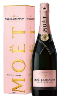
Moët & Chandon Rosé Giftbox