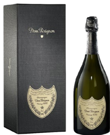
Dom Pérignon Giftbox