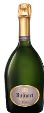
„R“ de Ruinart